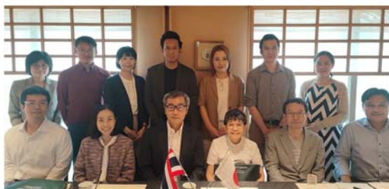
元留学生らとの記念撮影