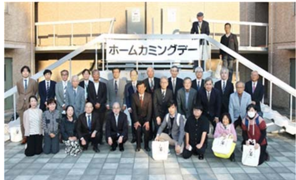
参加者の集合写真

※当日の様子はこちらから https://koyukai.admin.saga-u.ac.jp/hp/hcd/11/